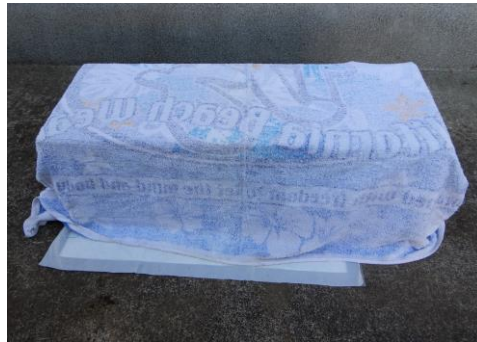
⑤捕獲後、捕獲器底部にオムツ シートをガムテープで固定し、 全体を布で覆う