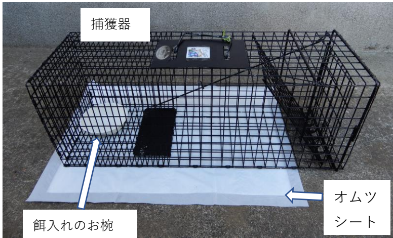
①捕獲器の全体像（扉を閉じた状態）