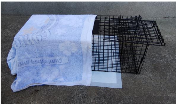
④餌付け及び捕獲待機時には餌側を 布で半分覆う