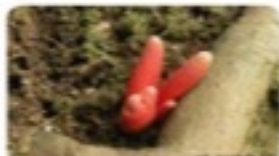
猛毒キノコ「カエンタケ」にご注意。 大和国志