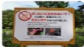
大和国志 観光業むすびかき、赤いキノコ、 大和国志 - 和PAGET