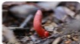
カエンタケ(きのこ図鑑) きのこ図鑑