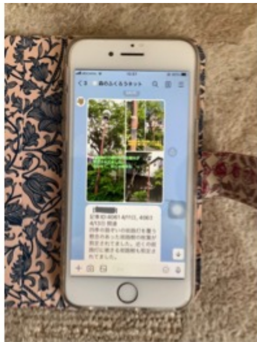
樹木による街灯の隠れ情報