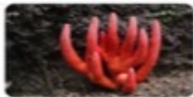
カエンタケ(きのこ図鑑) きのこ図鑑

風月亭の梅林を下って花壇までの途中に物置小屋があります。その周辺で「カエンタケ」が見つかりました。除去しましたが猛毒なのでご注意ください。