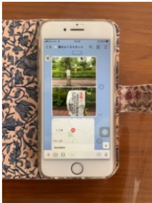
スズメバチの巣情報