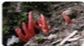
カエンタケ - Wikipedia Wikipedia